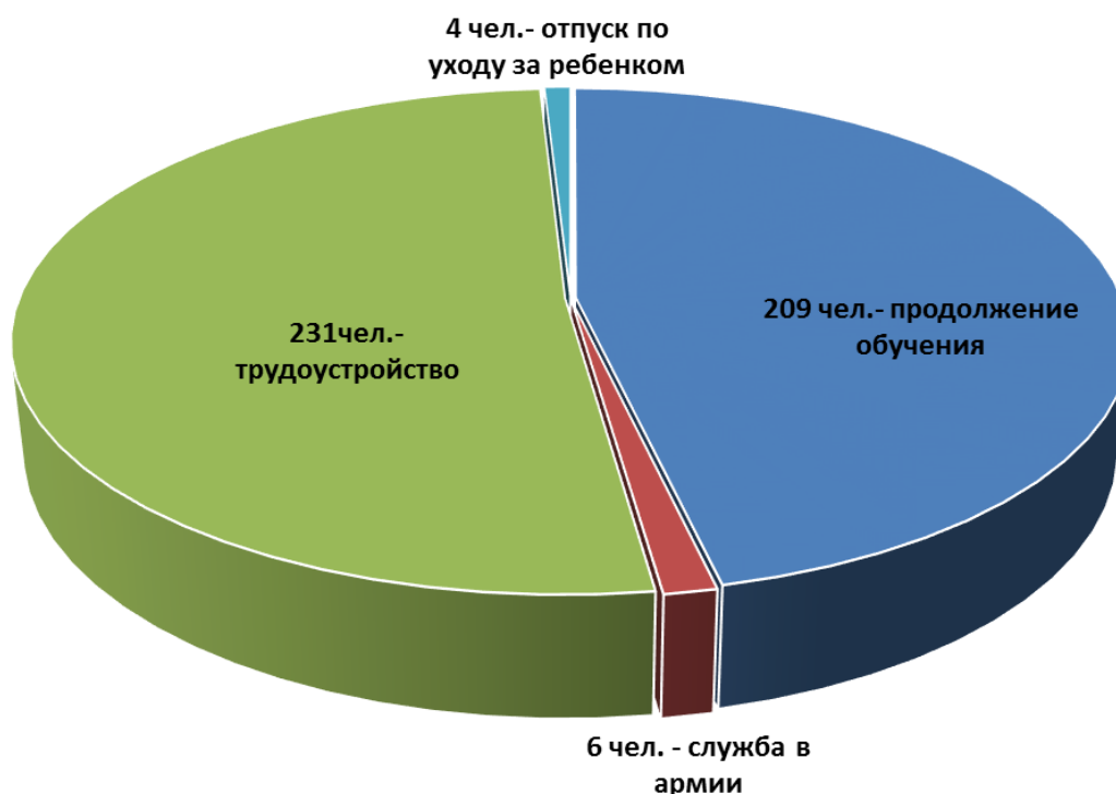
Распределение выпускников 2015 года